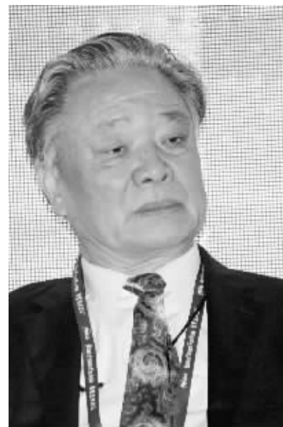
中国民营企业联合会会长保育钧

美银美林董事总经理刘二飞则认为，国有银行、股份制银行由于政策层面的原因，而且日子过得太舒服了，在短期之内学不会给中小企业贷款。这既是一个问题，但同时也给新兴的小型金融服务机构的发展提供了一个机会。他还建议，可尝试允许外资金融机构进入温州。