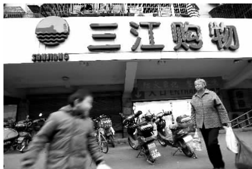
浙江宁波三江购物门店

2008年、2009年和2010年前三季度,三江购物净增加门店数量分别为9家、20家和16家,当年净增门店经营面积分别为30万平方米、55万平方米和53万平方米,