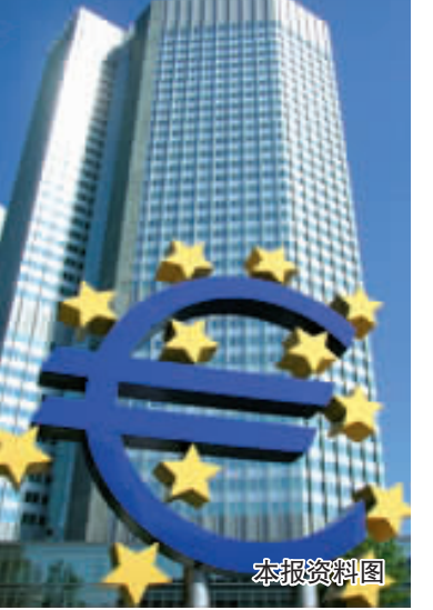
此外,欧债危机已经殃及英国。英国商会日前将今年英国经济增长预期从之前的0.6%下调至0.1%。德意志银行和花旗集团表示,英国经济仍然处于衰退状态,或将促使英国央行重启经济刺激计划。德意志银行经济学家巴克利预计,英国央行将在7月份增加500亿英镑的债券购买计划。

欧洲央行管理委员会委员、意大利央行行长维斯科表示,欧洲央行可以使用一系列工具令市场冷静下来,并且准备在必要时采取行动。意大利前总理贝卢斯科尼更表示,若欧洲央行再不推出量化宽松政策以扭转欧债危机,意大利或将退出欧元区。市场预计,5月份欧元区通胀率将降至2.4%,创下近15个月以来的新低。有分析人士表示,欧洲央行官员在本周的政策会议上,恐怕很难再以“担心通胀为由”拒绝降息。有市场人士更预计,欧洲央行只能选择下调利率,最快或在本周宣布降息。