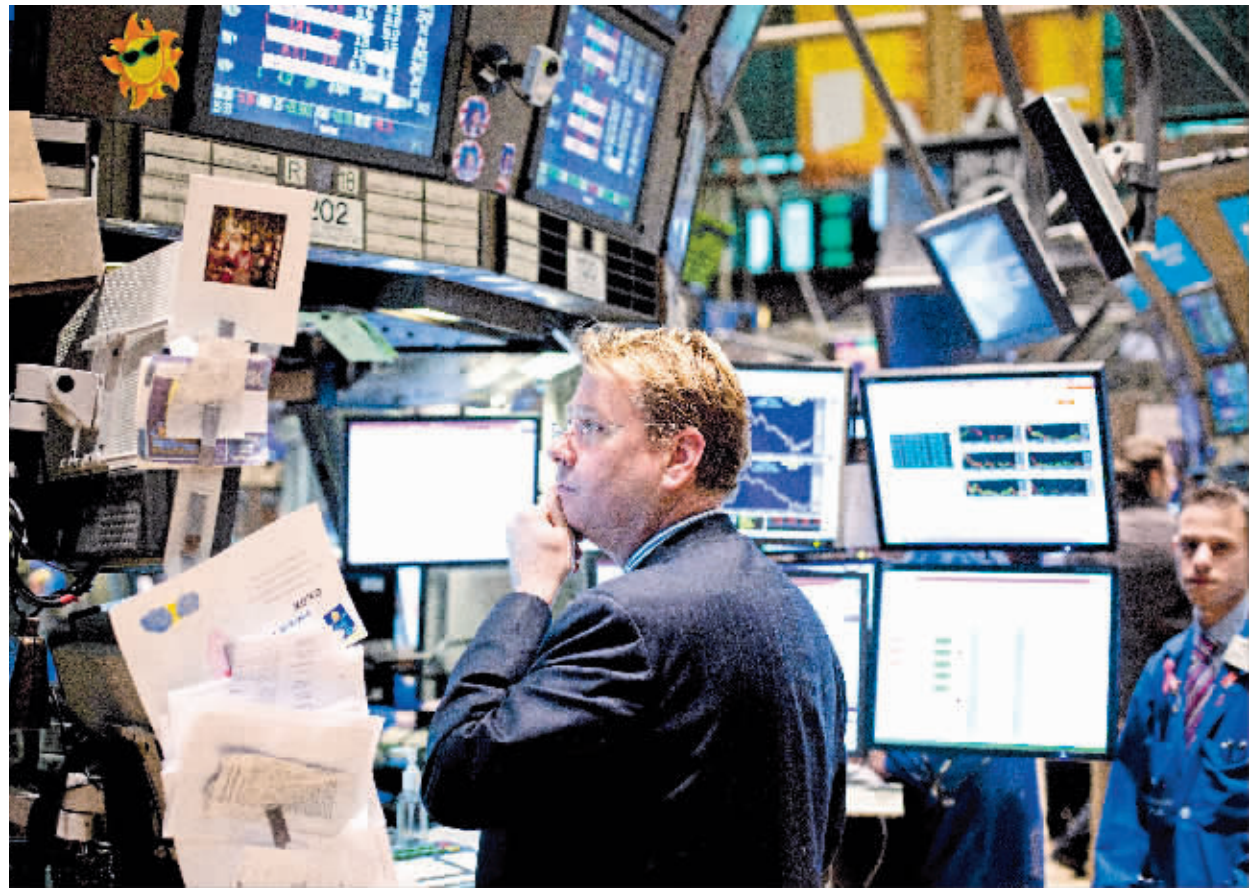
希腊政局混乱、西班牙银行危机、美国就业市场不景气等多重因素导致上周五美国股市大跌。

美联储主席伯南克此前暗示,美联储将保留包括QE3在内的所有货币政策措施。本周,伯南克将在美国国会联合经济委员会就经济前景发表证词,市场对此密切关注。此外,6月份是美联储“扭转操作”的最后一个月份。波士顿联储行长罗森格伦表示,美联储应该延长所谓的“扭转操作”措施,以此促进美国经济增长和压低失业率。