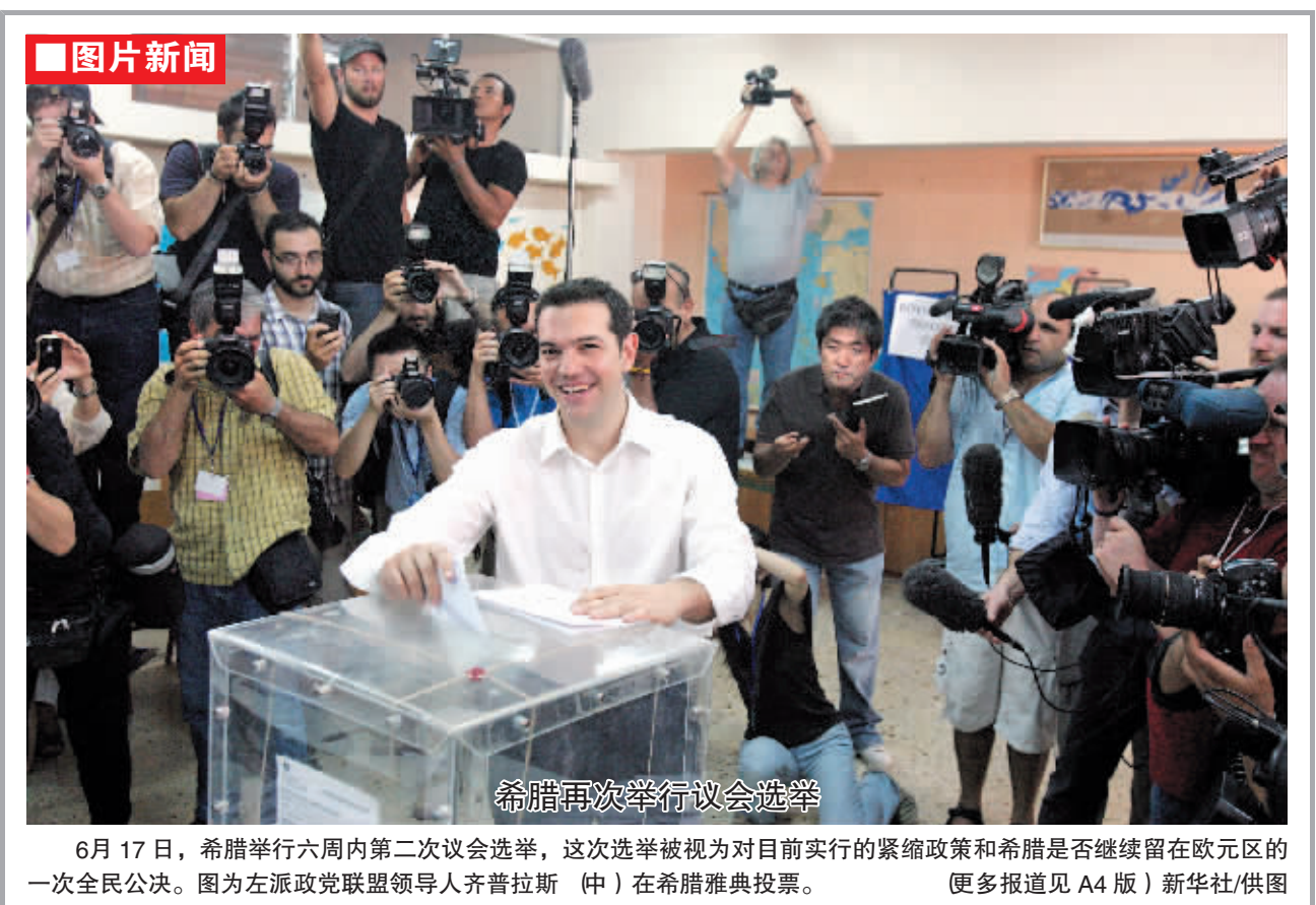
图片新闻 6月17日，希腊举行六周内第二次议会选举，这次选举被视为对目前实行的紧缩政策和希腊是否继续留在欧元区的一次全民公决。图为左派政党联盟领导人齐普拉斯(中)在希腊雅典投票。(更多报道见A4版)

据新华社电 赴墨西哥洛斯卡沃斯出席二十国集团领导人第七次峰会前夕，国家主席胡锦涛接受了墨西哥主流媒体书面采访，就二十国集团峰会等问题阐述了中方立场和主张，并介绍了中国经济形势及前景。 关于洛斯卡沃斯峰会，胡锦涛表示，当前，世界经济继续保持复苏态势，经济增长前景有所改善，但复苏的不稳定不确定因素依然突出，全球总需求依然不足，主要经济体增长乏力，各国宏观经济政策协调难度增加。实现世界经济强劲、可持续、平衡增长还要付出艰苦努力。 胡锦涛指出，在当前世界经济形势下，二十国集团各成员应该本着同舟共济、互利共赢的精神，共同致力于保增长、促稳定，巩固并增强来之不易的经济复苏势头。为此，我们要继续加强宏观经济政策协调，在合作中谋求共赢。要继续推进国际金融体系改革，尽快完成国际货币基金组织份额和治理改革目标，完善国际货币体系，加强国际金融监管。要继续反对各种形式的保护主义，推动多哈回合谈判。要继续重视发展问题，努力促进发展中国家经济发展，以此带动全球总需求扩大。对欧洲主权债务等各方普遍关注的问题，二十国集团要以建设性和合作性的方式予以讨论，鼓励并支持各方有关努力，共同向市场传递信心。 关于中国经济形势，胡锦涛指出，当前，中国经济运行总体平稳。在外部