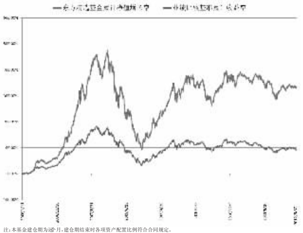
注:本基金建仓期为6个月,建仓结束时各项资产配置比例符合合同约定。