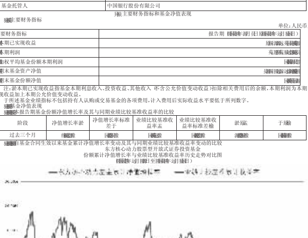
注:本基金建仓期为6个月,建仓结束时各项资产配置比例符合合同约定。