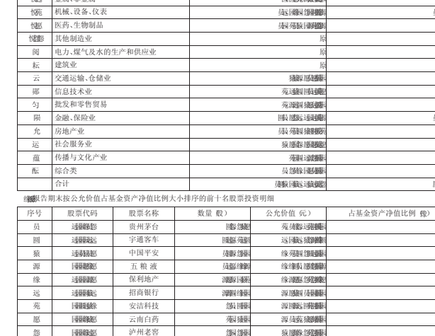
注:本基金建仓期为6个月,建仓结束时各项资产配置比例符合合同约定。