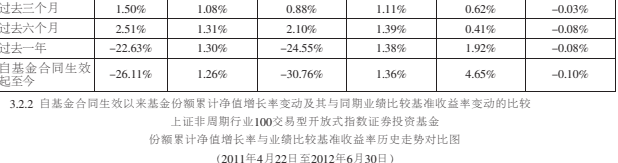
注:按照本基金合同约定,本基金建仓期为基金合同生效之日起三个月,截至本报告期末基金的各项投资比例已达到基金合同第十三章(二)投资组合范围。(六)投资限制中规定的各项比例。

3.2.2 自基金合同生效以来基金份额净值变动及其与同期业绩比较基准收益率变动的比较 注:本基金建仓期为基金合同生效之日起三个月,截至本报告期末基金的各项投资比例已达到基金合同第十三章(二)投资组合范围。(六)投资限制中规定的各项比例。