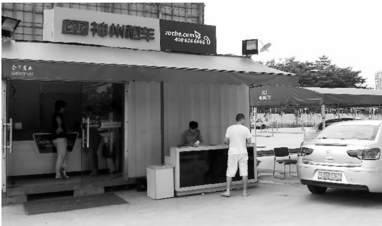
位置并不显眼的神州租车深圳香蜜湖店,近期前来租车的人数明显增加

上述负责人还表示,目前神州租车已接到超过往年国庆期间半数的订单,但这并非预订高峰,根据以往的市场经验,真正的高峰期可能在国庆中秋长假