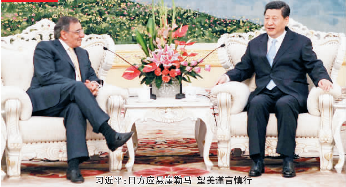
习近平:日方应悬崖勒马 望美谨言慎行

国家副主席、中央军委副主席习近平昨日会见来访的美国国防部长莱昂·帕内塔时表示,日本国内一些政治势力非但不深刻反省对邻国和亚太国家造成的战争创伤,反而变本加厉、一错再错,演出“购岛”闹剧。日方应该悬崖勒马,停止一切损害中国主权和领土完整的错误言行。希望美方从地区和平稳定大局出发,谨言慎行,不要介入钓鱼岛主权争议,不要做任何可能激化矛盾和令局势更加复杂的事情。