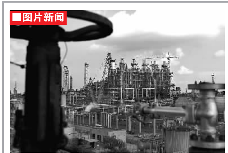
科技部“863”重点攻关项目——大庆石化120万吨年乙烯改扩建工程于国庆节期间成功投产。大庆石化120万吨年乙烯改扩建工程是在原有60万吨年乙烯装置基础上进行的。新建装置和成套技术全部实现国产化，打破了长期以来国外的技术垄断，节约了上千万美元的技术引进资金。该项目经国务院批准，总投资129亿元，于2010年9月动工建设，比原计划提前一年时间完工。

沧州大化同样也上调了10月的出厂价，沧州大化10月份TDI挂牌执行2.8万元/吨(预付款价)，较9月上调6200元/吨，上调幅度超过28%。9月份结算价在2.4万元/吨~2.6万元/吨，其中华北执行2.4万元/吨，华南执行2.6万元/吨，其他执行2.46万元/吨。