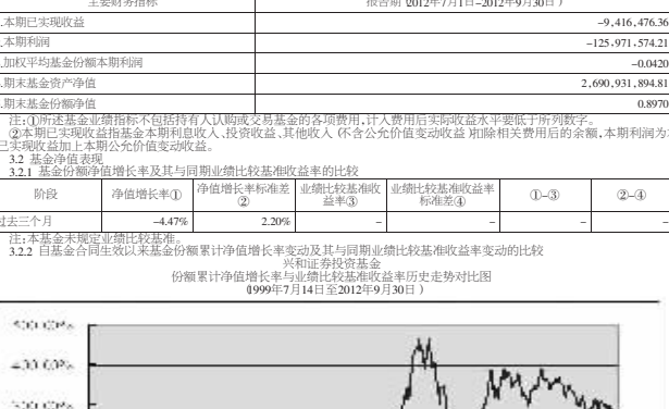
注:本基金未约定定期业绩比较基准。