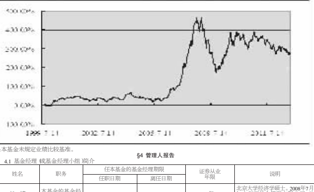
注:本基金未约定定期业绩比较基准。