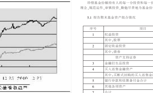
图1:本基金自成立以来的基金份额净值增长率及其与同期业绩比较基准收益率的比较

基金管理人承诺以诚实信用、勤勉尽责的原则管理和运用基金资产,但不保证基金一定盈利,也不保证基金份额持有人的本金不受损失。