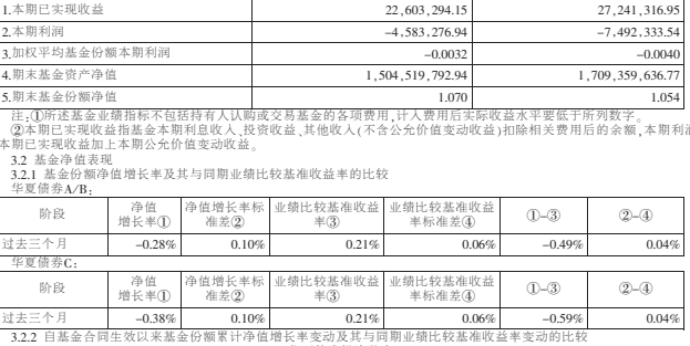
图1:本基金自成立以来的基金份额净值增长率及其与同期业绩比较基准收益率的比较

基金管理人承诺以诚实信用、勤勉尽责的原则管理和运用基金资产,但不保证基金一定盈利,也不保证基金份额持有人的本金不受损失。