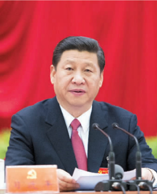
11月15日,中共十八届一中全会在北京人民大会堂举行。习近平同志主持会议并作重要讲话。