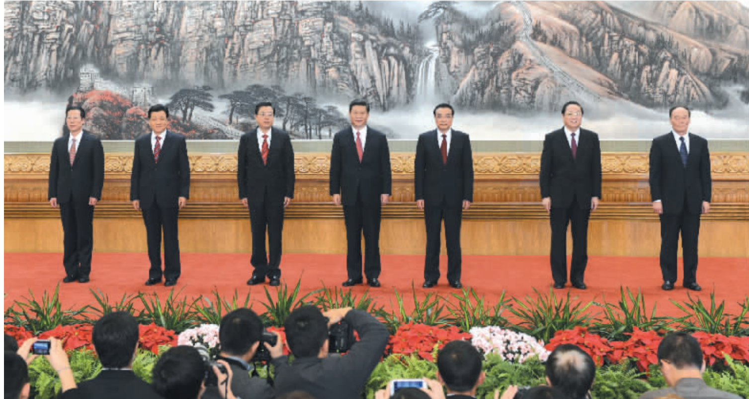
11月15日,在党的十八届一中全会上当选的中共中央总书记习近平和中共中央政治局常委李克强、张德江、俞正声、刘云山、王岐山、张高丽在北京人民大会堂同采访十八大的中外记者亲切见面。

据新华社电 中国共产党第十八届中央委员会第一次全体会议,于2012年11月15日在北京举行。 出席会议的有中央委员205人,候补中央委员171人。中央纪律检查委员会委员列席会议。 习近平同志主持会议并作了重要讲话。 全会选举了中央政治局委员、