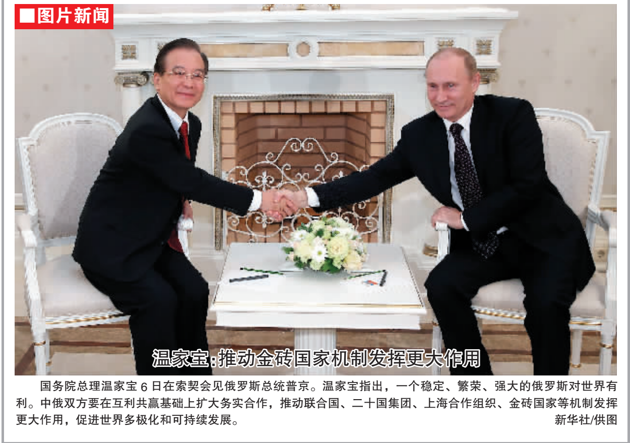
温家宝：推动金砖国家机制发挥更大作用

国务院总理温家宝6日在索契会见俄罗斯总统普京。温家宝指出，一个稳定、繁荣、强大的俄罗斯对世界有利。中俄双方要在互利共赢基础上扩大务实合作，推动联合国、二十国集团、上海合作组织、金砖国家等机制发挥更大作用，促进世界多极化和可持续发展。