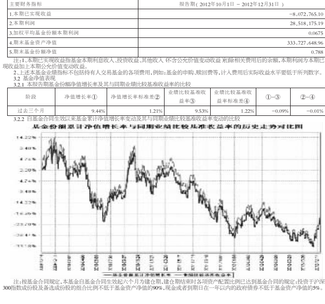
注:1.本基金业绩比较基准为沪深300指数收益率+50%+中国债券综合指数收益率+48%。

重要提示 基金管理人承诺以诚实信用、勤勉尽责的原则管理和运用基金资产,但不保证基金一定盈利,也不保证基金份额持有人的本金不受损失,投资者在作出投资决策前应仔细阅读本基金的招募说明书。