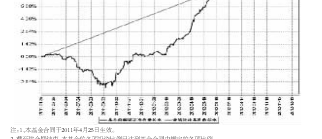
注:1.本基金合同于2011年4月25日生效。 2.截至本报告期末,本基金的各项投资比例已达到基金合同中规定的各项比例。