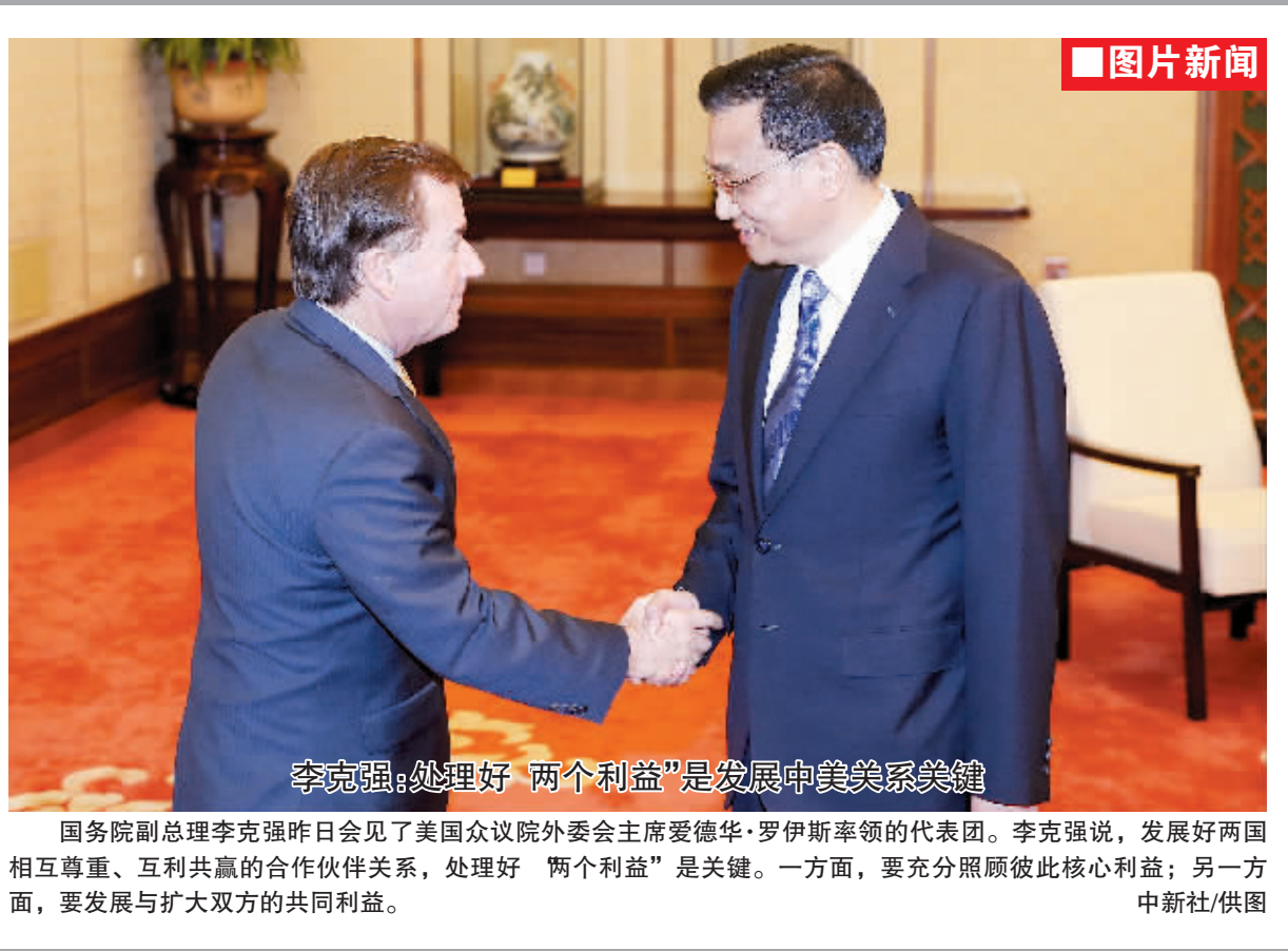
李克强:处理好“两个利益”是发展中美关系关键 国务院副总理李克强昨日会见了美国众议院外委会主席爱德华·罗伊斯率领的代表团。李克强说,发展好两国相互尊重、互利共赢的合作伙伴关系,处理好“两个利益”是关键。一方面,要充分照顾彼此核心利益;另一方面,要发展与扩大双方的共同利益。