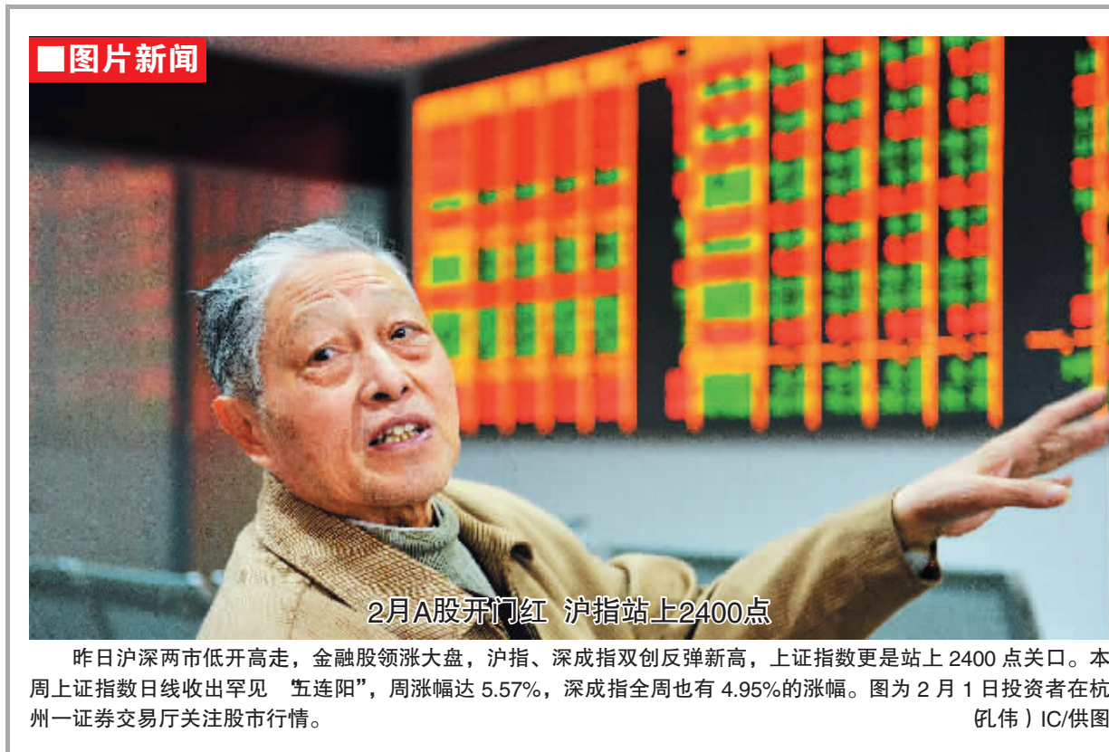
2月A股开门红 沪指站上2400点 昨日沪深两市低开高走，金融股领涨大盘，沪指、深成指双双反弹新高，上证指数更是站上2400点关口。本周上证指数日线收出罕见“五连阳”，周涨幅达5.57%，深成指本周也有4.95%的涨幅。图为2月1日投资者在杭州一证券交易厅关注股市行情。(刘伟) IC/供图