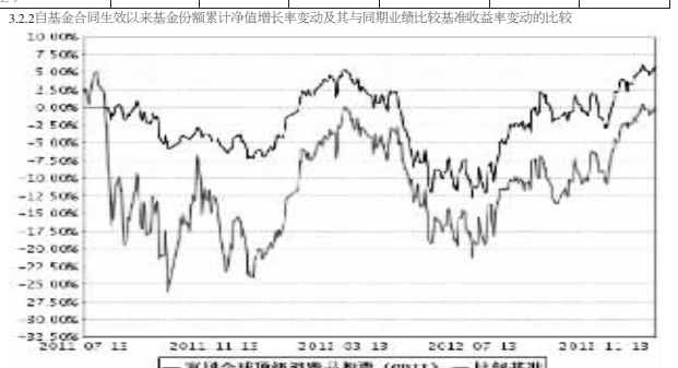
图1 富国全球顶级消费品股票(QDII)——比较基准

注:截止上期末2012年12月31日,本基金组合6个月以内2011年7月13日起至2012年1月12日建仓结束时各项资产配置比例均符合基金合同约定。