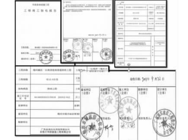
图1 梅州城区—江两岸夜景亮化工程验收报告部分页面