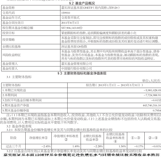
图:嘉实深证基本面120ETF基金份额净值增长率与同期业绩比较基准收益率的历史走势对比图 注:按基金合同和招募说明书的约定,本基金自合同生效日起3个月内为建仓期,建仓期结束时本基金的各项投资比例符合基金合同“1.5基金的投资”(一)“投资范围”(八)“2.基金业绩比较比例限制”的有关约定。

3.1 主要财务指标 单位:人民币元 1.本期已实现收益 -5,981,028.05 2.本期利润 -7,224,980.91 3.加权平均基金份额本期利润 -0.0132 4.期末基金份额净值 443,740,316.10 5.期末基金资产净值 443,740,316.10