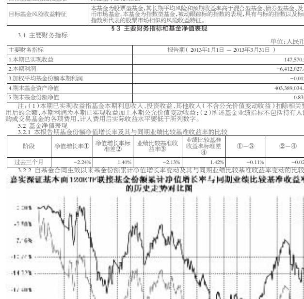
图:嘉实深证基本面120ETF联接基金份额净值增长率与同期业绩比较基准收益率的历史走势对比图 注:按基金合同和招募说明书的约定,本基金自合同生效日起3个月内为建仓期,建仓期结束时本基金的各项投资比例符合基金合同“1.5基金的投资”(二)“投资范围”(八)“2.基金业绩比较比例限制”的有关约定。

3.1 主要财务指标 单位:人民币元 1.本期已实现收益 147,570.54 2.本期利润 -6,412,027.46 3.加权平均基金份额本期利润 -0.0127 4.期末基金份额净值 403,389,034.34 5.期末基金资产净值 403,389,034.34