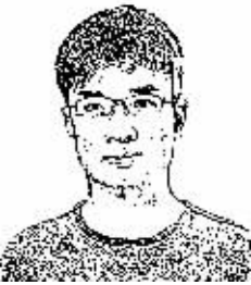
证券时报记者 颜金成

最近，金银价格暴跌。没记错的话，在暴跌之前，少有财经新闻分析说黄金会跌，更多的是谈全球货币放水，看好黄金无疑。从这一现象中，我们要引入投资者应该如何去看待财经新闻这一话题。