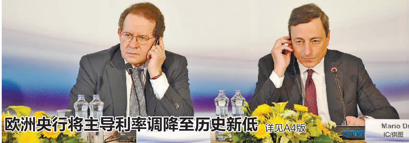
欧洲央行将主导利率调降至历史新低 详见A4版