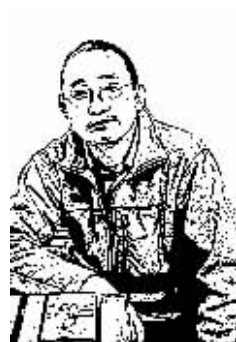
证券时报记者 徐涛

等，无不惊天动地、摄人心魄，无疑都属出类拔萃之题，但细琢磨，就难免品出“炒作”的味道。