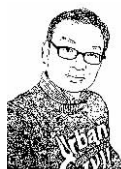
证券时报记者 郑晓波

上周五,证监会对万福生科造假上市一案涉案各方开出了史上最严厉罚单,彰显监管层从治市决心。保荐机构平安证券亦公布了先行补偿方案。无论是巨额罚单,还是先行补偿方案,对今后此类案件的处理都具有标杆意义。