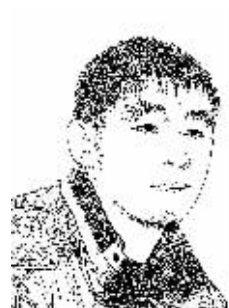
证券时报记者 贾壮

国内的媒体统称房利美和房地美为“两房”。“两房”在被美国政府接管之前,的确“美”了很长时间。作为政府支持公司,“两房”可以使用国家信用低成本融资,购买其他初级市场贷款者的住房抵押贷款,使这些机构能够获得充足的资金为购房者提供融资便利,从而帮助美国人实现拥有住房的梦想。