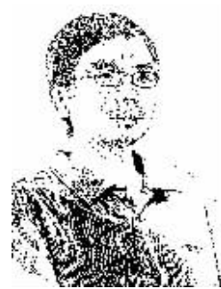
证券时报记者 孙勇

“要进一步强化审计工作，用‘火眼金睛’看好国家钱财，确保公共资金节约、合理、有效使用。”这是李克强总理17日考察审计署时所说的一番话。对于这个生动形象的“火眼金睛”论，众多媒体进行了浓墨重彩的报道。不过，在我看来，李总理在这次考察中所表达的另一个观点更有现实意义，即改革红利的释放有赖于审计工作的倒逼机制。 李总理所说的“要以审计倒逼各项制度的完善，释放改革红利，推动建立不敢贪不能贪的机制”，其观点浓缩起来就是：以审计倒逼改革。 应该承认，在推动政府财务公开方面，审计署这些年做了大量卓有成效的工作。审计署前任审计长李金华以审计从严、敢说敢做著称，被公众誉为“铁面审计长”。而审计署在民间获