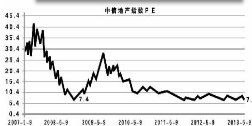
地产板块PE估值已回到历史价值区间