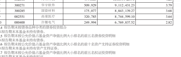
注:按照相关法规规定,本基金自基金合同生效日起6个月内为建仓期,报告期内本基金的各项投资比例符合基金合同的有关规定。

5.2 主要财务指标和基金净值表现 3.1 主要财务指标 单位:人民币元 主要财务指标 报告期(2013年6月1日至2013年6月30日)