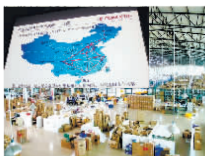
京东发力开放平台 暗战菜鸟