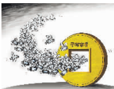
今年国内手游收入 将达100亿