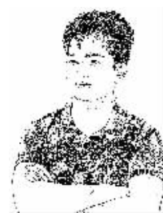
证券时报记者 李雪峰

5年之后。地方基建冲动与工信部产能调控客观上形成了冲突，但过度指责地方政府及企业以经济规模为纲显然有失公允，实际上，目前的产能过剩局面在相当程度上是为此前的非理性产业规划和集中审批埋单。