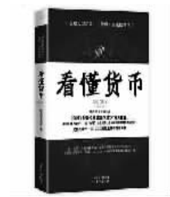
书名《看懂货币》 作者:陈思进 金蓓蕾 出版社:东方出版社