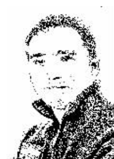
证券时报记者 夏天

国内车主每隔一两年就要升级导航地图，否则容易走错路。我把这事告诉来自美国的亚历克斯，这位“中国通”觉得非常惊讶，他夸张地耸耸肩，问我：“城市地图还用更新吗？”