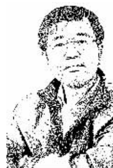
证券时报记者 肖国元

光大证券8·16乌龙指事件之后，围绕事件性质认定与处罚问题的讨论可谓众说纷纭，其中有两种观点颇具代表性：一种从操作的技术性角度为光大证券辩解，认为在系统故障之后，为对冲风险而在股指期货上开空仓是为了弥补损失，有其正当性；另一种观点则认为，光大证券是响当当的国企，管理层肯定会高抬贵手，放它一马。