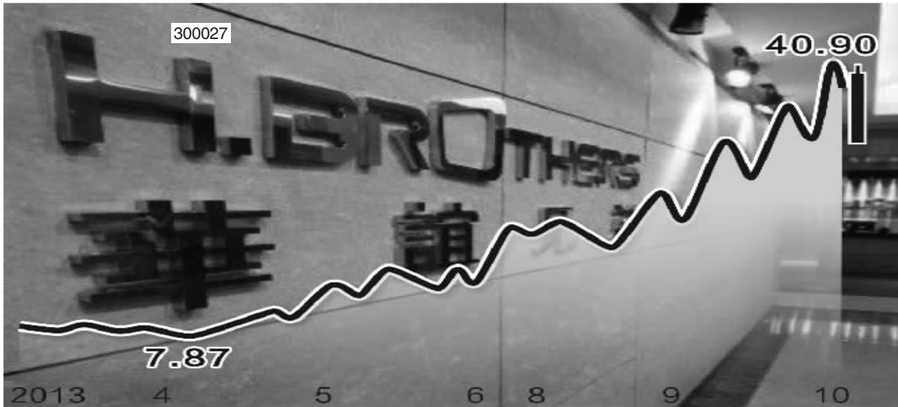
华谊兄弟前复权 K 线图