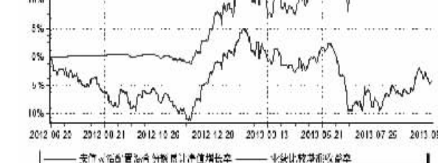
图1:安信策略精选灵活配置混合型证券投资基金净值增长率与业绩比较基准收益率变动的比较

注:2.本基金业绩指标不包括持有人认购或交易基金的各项费用,计入费用后实际收益水平要低于下列数字。