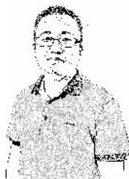
证券时报记者 罗克关

上期限的资金价格中枢,与 Shibor 已经实现市场化的短期资金利率曲线完整对接。在此基础上,央行可以更为从容地推进面向普通储户的大额可转让定期存单,并如愿在中期实现全面的利率市场化。