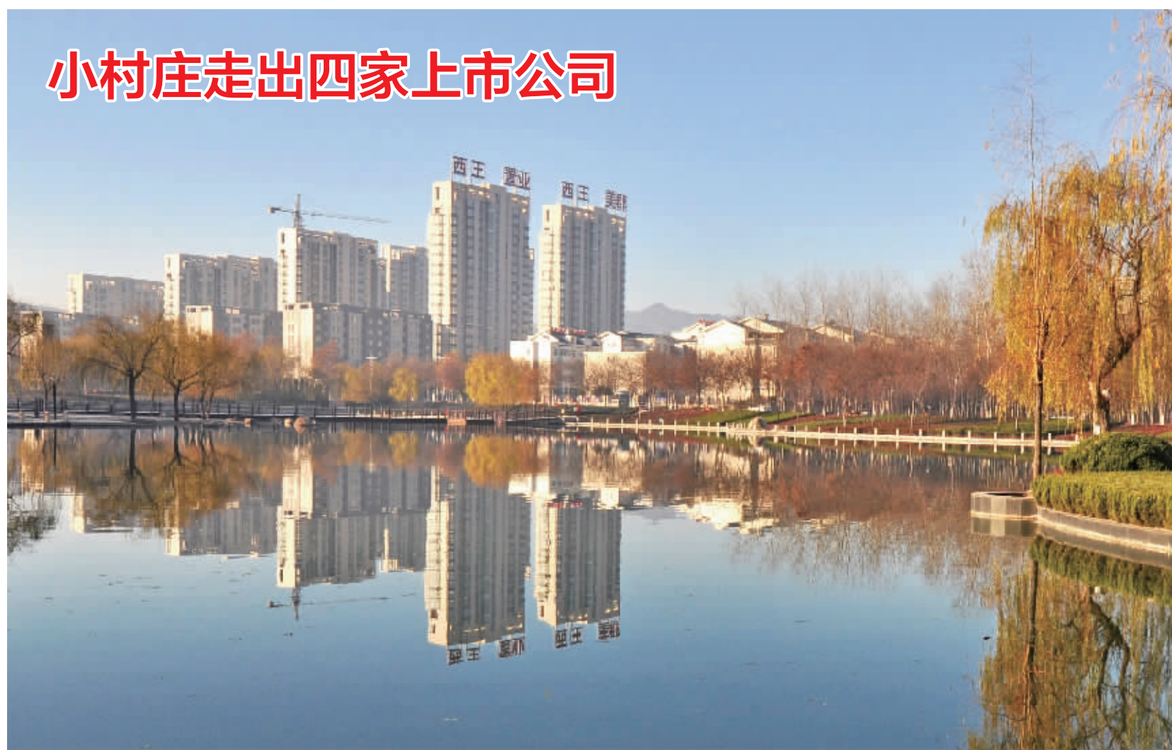
位于山东北部邹平县韩店镇的西王村,是一个只有160户约720人的小村庄,却拥有总资产304.8亿元,人均年收入逾10万元。更令人惊叹的是,该村目前已有西王置业、西王食品、西王特钢、中国玉米油等4家公司在港深两地上市,被誉为中国上市企业第一村。