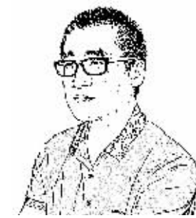
证券时报记者 朱健

风险,生来就是难测的;脸谱,本身就是多彩的。2014年的人民币汇率“风险脸谱”,希望也是五颜六色、异彩纷呈的。如果仍纠结于升值多少或贬值多少,那货币与货币的交易本身就失去了意义,汇率衍生品的创新也就成了无源之水。