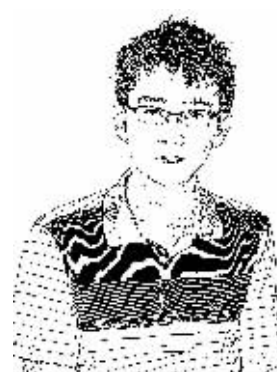
证券时报记者 靳书阳

日前，北京市住建委颁发了2014年首批3个住宅项目预售许可证，其中两个为高端住宅类项目，预售价格在每平方米6万元以上。这或许预示着2013年年底阶段性执行的4万元预售限价令解禁。