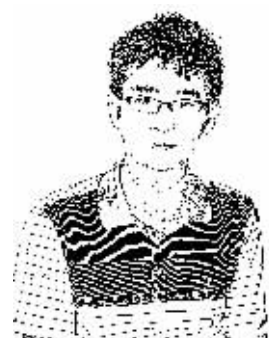
证券时报记者 靳书阳

就业的非户籍劳动者无法享受到足够的公共服务,无法真正在工作地安家立业,无法获得心理上的归属感。一旦春节这个最具中国特色的合家团圆节日来临,归乡的欲望自然更加强烈,也加大了春运期间的客运压力。