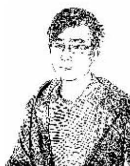
证券时报记者 蔡恺

近年来数家大型房企入股银行，引发业界热烈讨论，有观点认为，“房企涉银”能便利房企融资，减轻房企融资成本。实际上，房企涉银后获得的融资便利不宜夸大，银行也不会变成房企股东的“提款机”。