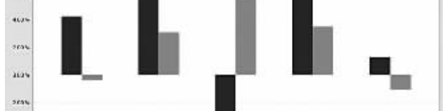
注:本基金自2009年3月18日起,根据招募说明书约定,将基金份额分为A类和C类。