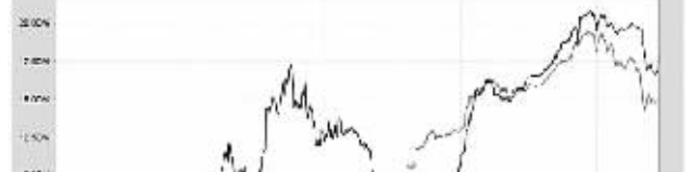
注:图中列示的2009年度基金净值增长率按年度本基金实际存续期(自18日起)至12月31日止计算。