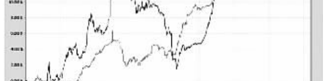
注:按照本基金合同规定,本基金建仓期为基金合同生效之日起六个月,建仓期至今本基金的各项投资比例均达到基金合同第十一章(二)投资范围、(六)投资组合限制中规定的各项比例。