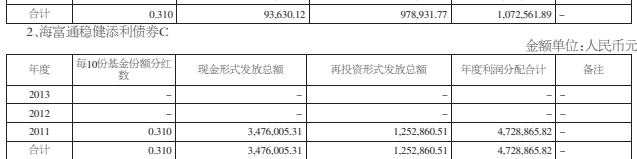
注:本基金自2009年3月18日起,根据招募说明书约定,将基金份额分为A类和C类。