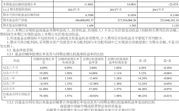
注:1.按照本基金合同约定,本基金在成立满六个月后,截至报告期末本基金的各项投资比例已达到基金合同第十二条(二)投资范围、本基金投资比例的各项指标。

3.2 基金净值表现 3.2.1 基金份额净值增长率及其与同期业绩比较基准收益率的比较 3.2.2 基金净值增长率与业绩比较基准收益率历史走势对比图