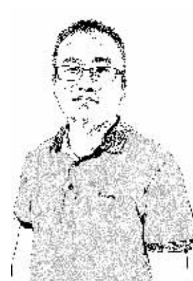
证券时报记者 罗克光

正当市场对银行风险的担忧有所抬头之时，酝酿多时的资本管理高级方法终于靴子落地。上周中行和工行陆续公告，称已经获得银监会核准实施资本管理高级方法。此后还有消息显示，银监会此番至少核准了工、农、中、建、交五大行实施这一方法。