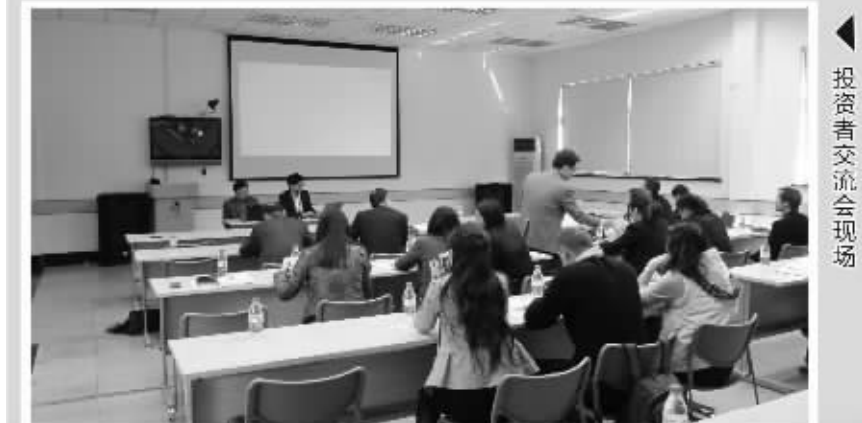
▲投资者交流会现场