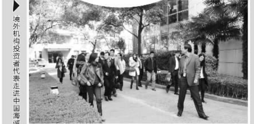
▲境外机构投资者代表走进中国海诚