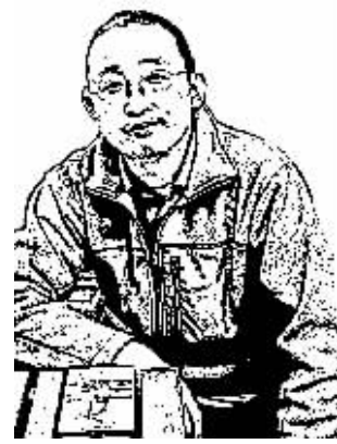
证券时报记者 徐涛

“保定副中心”遭到“通州副中心”的狙击，最终的结果，很可能让许多当初兴高采烈投奔保定而去的人空欢喜一场。其实，这样的结局，当初就应该预料到。