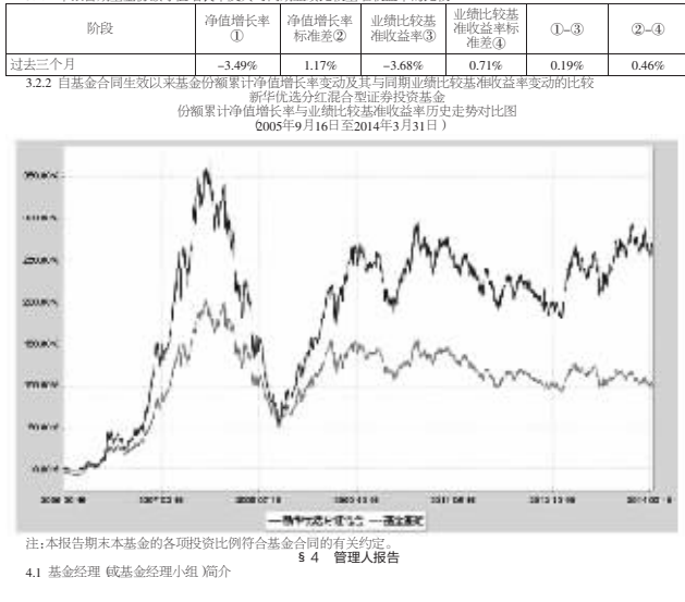
注:本报告期末,本基金各资产类别资产配置比例符合基金合同的规定。