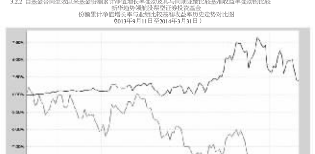
注:1.本报告期末,本基金各资产类别资产配置比例符合基金合同的规定。