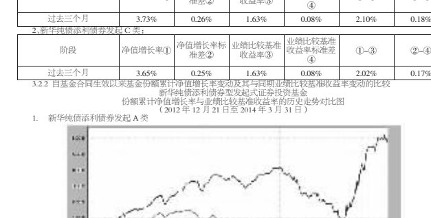
注：报告期内本基金的各项投资比例符合基金合同的有关规定