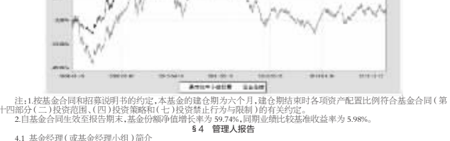
注：1.按基金合同和招募说明书的约定，本基金的建仓期为六个月，建仓期结束时各项资产配置比例符合基金合同(第十四章)中投资范围、(四)投资策略和(七)投资禁止行为的相关规定。 2.自基金合同生效至报告期末，基金份额净值增长率为99.78%，同期业绩比较基准收益率为5.98%。