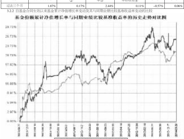
基金净值增长与同期业绩比较基准收益率的历史走势对比图 注:本基金合同约定本基金投资组合中,固定收益资产所占比例不低于基金资产的30%,权益类资产占比不超过基金资产的20%,且本基金持仓市值不得超过基金资产净值的5%。本基金的建仓期为自本基金合同生效之日起6个月,建仓期结束,各项资产占比符合合同约定。

基金投资组合报告 3.1 基金投资组合概况 3.2 基金投资组合报告 3.3 基金投资组合报告 3.4 基金投资组合报告 3.5 基金投资组合报告