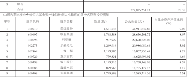
注:本基金自2013年11月20日起,按照本基金的基金合同约定,自基金合同生效之日起6个月内使基金的投资组合比例符合基金合同约定...

3.1 主要财务指标 本期基金份额净收益:1,689,366,279.04 期末基金份额净值:1.19 基金份额持有人户数:10,300