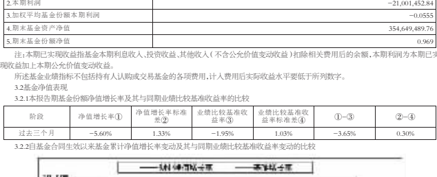
注:本基金自2013年11月20日起,按照本基金的基金合同约定,自基金合同生效之日起6个月内使基金的投资组合比例符合基金合同约定...

3.1 主要财务指标 本期基金份额净收益:365,923,173.20 期末基金份额净值:1.18 基金份额持有人户数:10,300