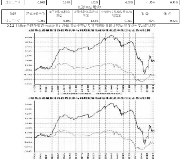
注:本基金建仓期为自《基金合同》生效之日起(2013年12月20日)起6个月,建仓结束日各项资产配置比例符合合同约定。