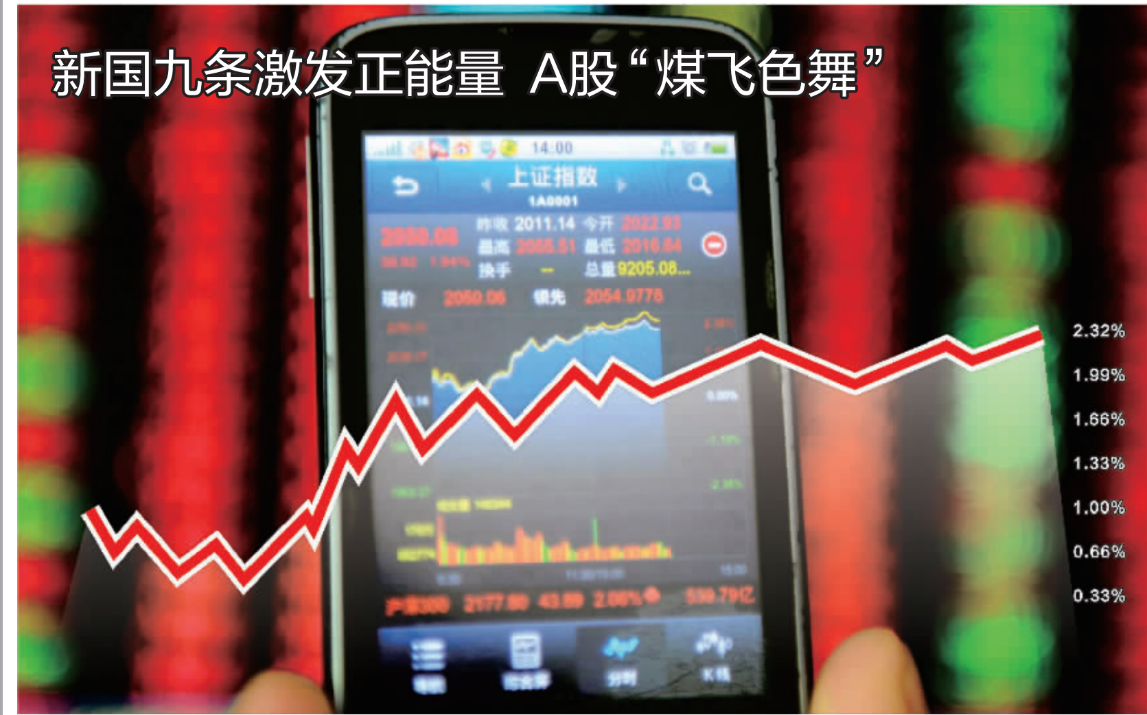
新国九条有效激发市场人气,深沪股市昨日强劲反弹,股指涨幅均超过2%。两市交投活跃,成交总量超过1700亿元。有色股涨势迅猛,并蔓延至煤炭股,当天煤炭指数大涨7.88%,成为拉动股指走升的主要动力。 彭春霞/制图

么这些职业接班人也就不论能力高低,兴趣爱好何在,统统都要接下这沉重的责任。自古以来,传承的难题就不好解决。就看历朝历代帝王之家,中兴之帝也不多。宋徽宗的丹青绘画,瘦金体书法是公认一流,可是大宋江山毁在他手上。刘备戎马一生,还留下智识才能忠心兼具的诸葛亮辅佐幼主,还是避免不了 此处乐,不思蜀”的阿斗命运。其实,雄才大略之人本就凤毛麟角,要指望富二代个个超越创一代,不切实际。更何况,中国这一代家族企业创始人大多出身家境贫寒,吃苦耐劳,在中国经济改革开放以来这三十多年的转型发展期抓住了机遇,获得了财富积累。然而,物质财富传承容易,能力、信仰、群体意识、创造力等等这些精神财富的传承不容易。不少富二代有国外读书经历,但在经验、胆识、处理复杂局面的能力和对企业经营的兴趣等方面都不易超过创一代。麦肯锡的研究报告显示,全球家族企业的平均寿命只有 24 年,其中只有约 30% 的家族企业可以传到第二代,能够传至第三代的家族企业数量不足总量的 13%,只有 5% 的家族企业在三代以后还能够继续为股东创造价值。由此推论,家族企业没能传承下去是正常现象,而那些传承下去的企业,则在接班人的选择上和配套制度安排上显然更为明智。企业管理界专家对财富传承给出的对策是设立基金会、搞家族信托、聘请外部“空降兵”等,这些已经逐渐为中国家族企业接受。而从长远看,笔者认为更重要的是对二代接班人的素质教育和正确的财富观的塑造。一代名臣林则徐的高论发人深省:“子孙若如我,留钱做什么?子孙不如我,留钱做什么?”看来,富豪们留给后代的不该只是财富,更重要的是创造财富的能力和对社会责任更强的公益心。